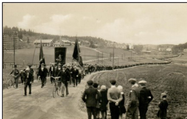
Ovan: Fotografi över demonstrationstågen 1931. Nedan: Bild på den nya krislådan.

Vi upplever att vår uppsökande verksamhet är uppskattad då det underlättar för skolor på landsbygden att ta del av kulturarvshistoria och att arbeta med kultur i skolan. Att föreställningen bygger på gamla arkivhandlingar gör det möjligt att koppla workshopen till både samhällskunskap och historia. Ett nytt besök är tänkt att göras på Kordeliaskolan med Ådalen-31 någon gång under hösten 2024.