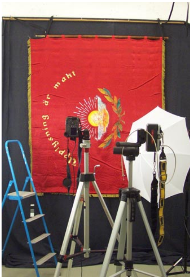
Den tillfälliga fotoateljén med digital och analog kamera, belysning och andra tillbehör. Fanan som hänger på väggen kommer från s-kvinnoklubben i Bonäset-Järved och mäter 1,5 x 1,8 meter.