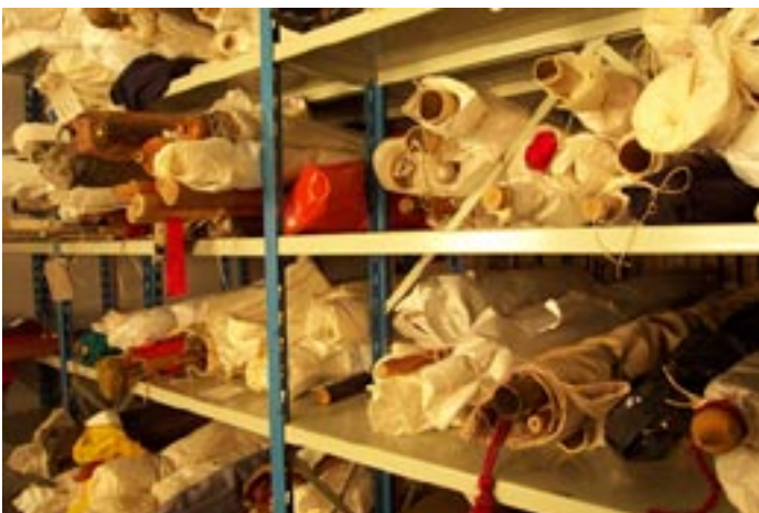
Tillfällig förvaring av fanorna, rullade kring sin egen stång vilket i längden är förkastligt.

Under fjolåret reserverades medel i arkivets budget för att kunna projektanställa någon för att utföra arbetet (tillsammans med ordinarie personal), och i slutet av januari 2004 anställdes Linda